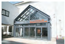
◀信州中野駅隣の 中野保健センター内に 事務所があります

☎ (22) 2111 (内線366) ファクス (22) 2295 住所：西一丁目1-7