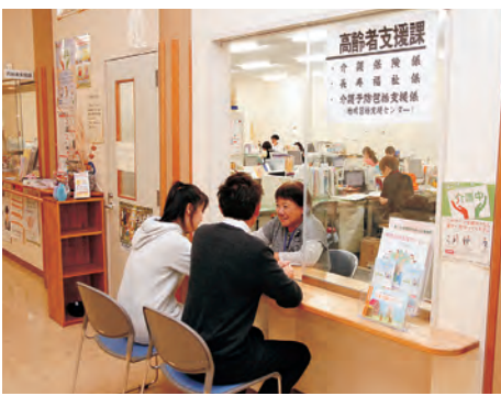
中野市地域包括支援センター (高齢者支援課介護予防包括支援係)

☎ (22) 2111 (内線366) ファクス (22) 2295 住所：西一丁目1-7