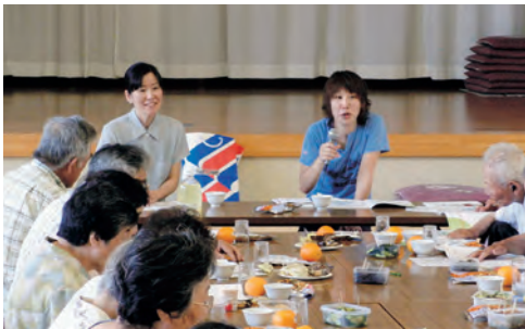
▲養成講座は数名からでも開催が可能です。