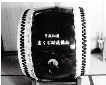
▲新野区で整備した長胴太鼓

この事業により、区民の地域行事への参加を促し、区民の触れ合いを通じて伝統文化の継承とコミュニティ活動の一層の推進が図られます。