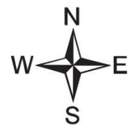
付図1号 土地利用計画図