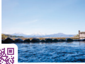
【MAP 1 C-5】