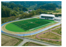
【MAP 1 A-2】