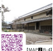
【MAP 2 B-4】