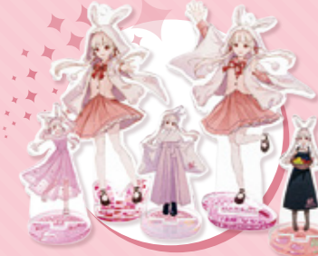
アクリルスタンド