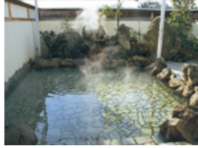
【MAP 1 B-3】