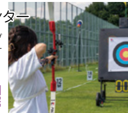
【MAP 1 B-3】