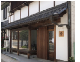
【MAP 2 B-3】