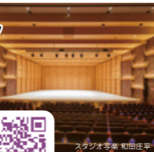
【MAP 2 B-4】