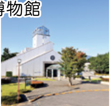
【MAP 1 B-3】