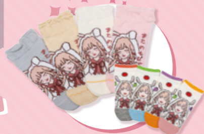
オリジナルソックス