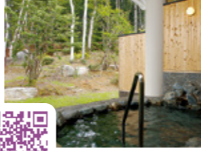
【MAP 1 A-1】