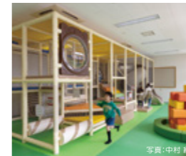
【MAP 1 B-3】