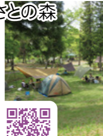
【MAP 1 B-3】