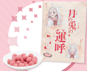
中野市名物!豆菓子 「月の兔の運呼(うんこ)」