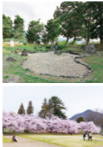
【MAP 2 C-2】