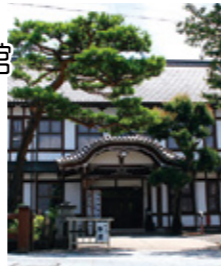
【MAP 2 B-3】